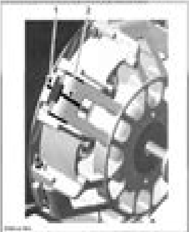
1. Mark on drive pulley locking bolt 2. Mark on governor cup

CAUTION: Prior to removing the drive pulley, mark sliding rail and governor cup together to ensure correct reinstallation. There are only 4 grooves mounted out of 8 possible positions.