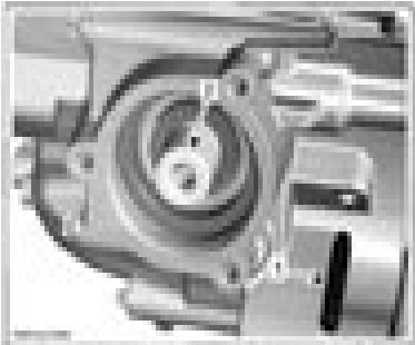
1. Crankshaft locking bolt 2. Crankshaft locking bolt